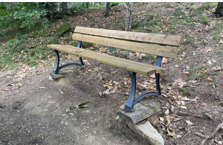
Modello in legno e metallo preesistente

Nuovo modello monoblocco senza schienale, costituito da listoni in legno lamellare e struttura in acciaio zincato a caldo e verniciata color nero RAL9005. Possibilità di personalizzazione con prolungamento del tavolo per utilizzo da parte dei disabili. Si prevedono, nello specifico, n.2 tavoli adatti all'utilizzo da parte di persone con sedia a rotelle.